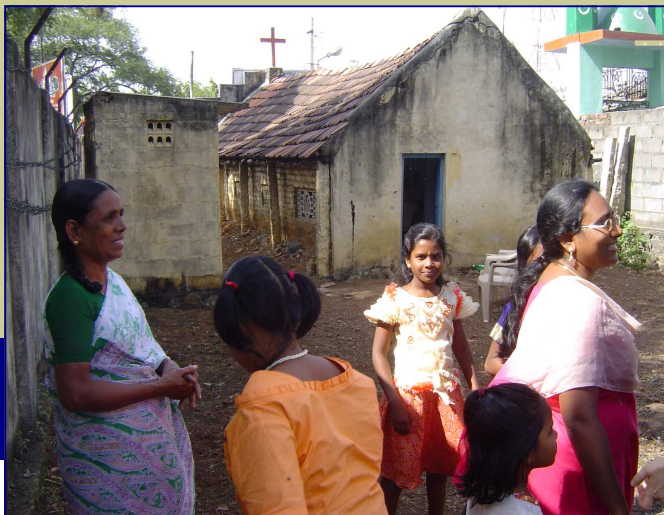
Il minareto di un'adiacente moschea

Il retro dell'ormai fatiscente chiesa. A sinistra i servizi.